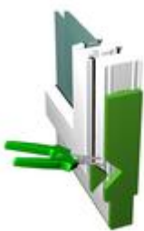
Bild 1: Abdichtung aussparen

Pulverbeschichtungs- und Lackierprozesse: SP351 kann nach dem vollständigen Aushärten kurzfristig erhöhten Temperaturen ausgesetzt werden und eignet sich somit zum Pulverbeschichten. Nachfolgende Einbrennprozesse sind ohne Veränderung der mechanischen Eigenschaften des Klebers möglich: +180°C über einen Zeitraum von max. 30 Minuten, +200°C über einen Zeitraum von max. 10 Minuten.